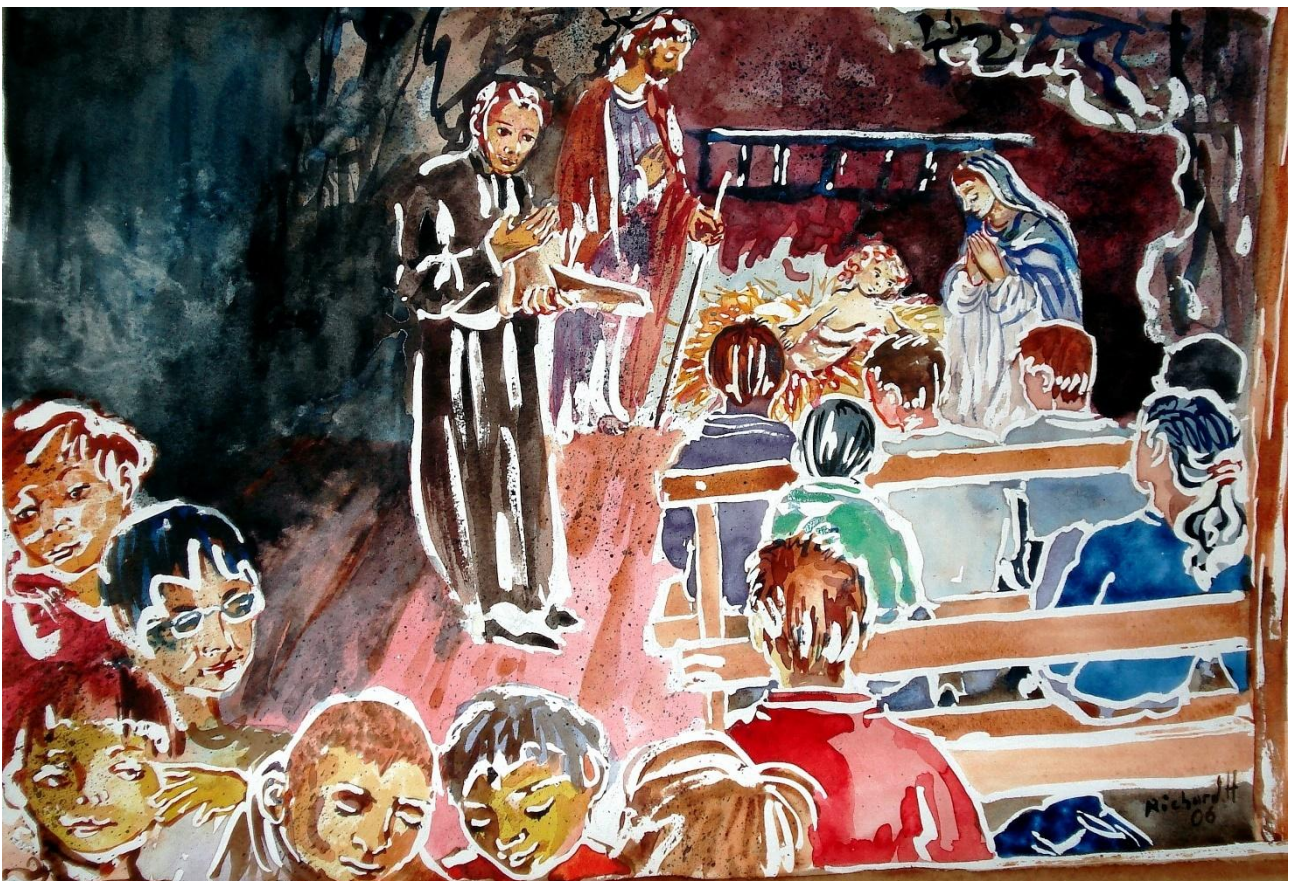
Aquarelle de Richard Holterbach.

L'espérance de la famille du Prado : comment la recevons-nous, comment la portons-nous aujourd'hui et comment la partageons-nous aux autres ?